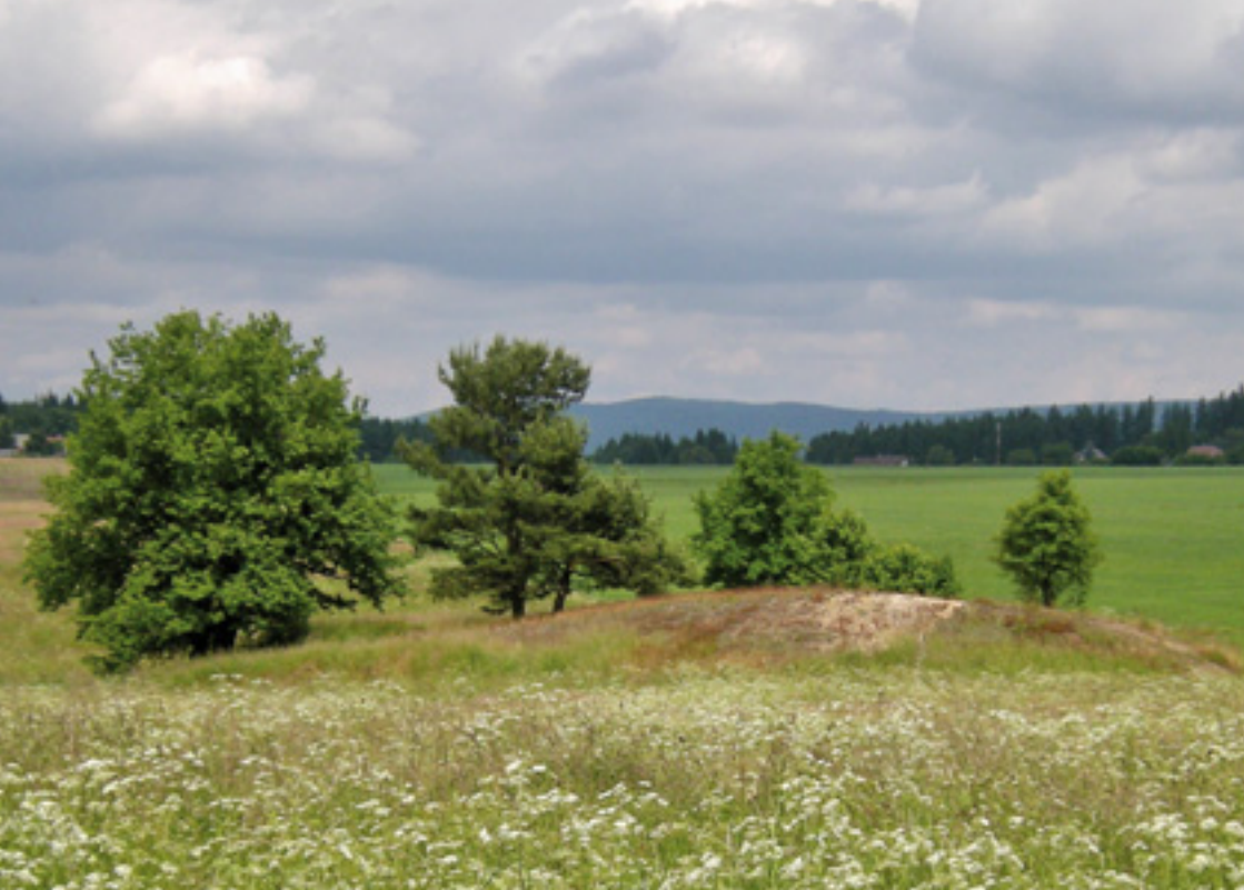
Stopy hornické činnosti severozápadně od obce Tři Sekery.